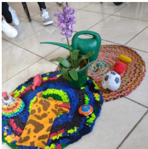
mento de Vínculos na Instituição CEI - Campinas