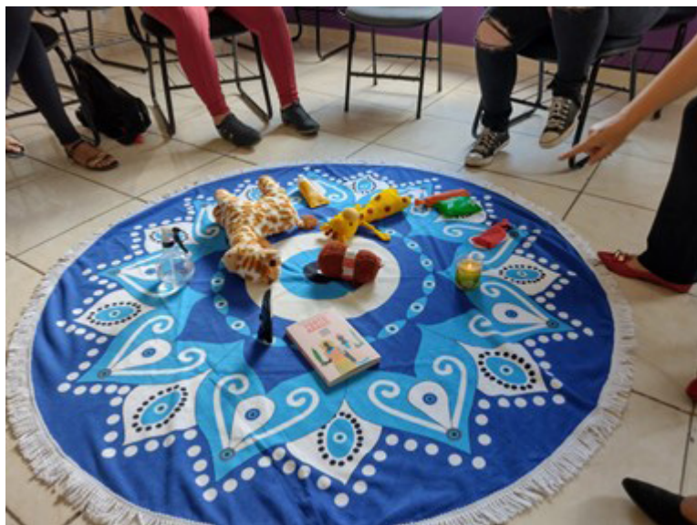
Foto 3: Círculo de Fortalecimento de Vínculos no Serviço de Convivência e Fortaleci-