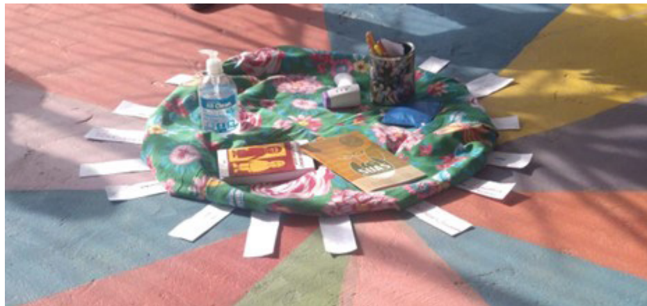
Foto 5: Círculo de Fortalecimento de Vínculos realizado na Instituição Progen