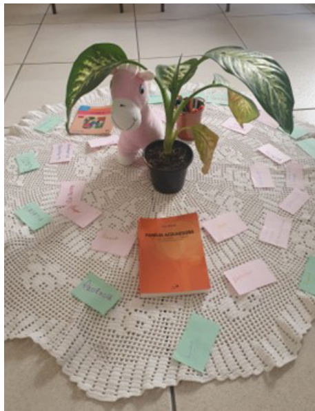
Foto 9: Círculo de Fortalecimento de Vínculo, realizado no CEI Campinas, pelo Grupo 2 da Turma 7 do Curso de Introdução à Justiça Restaurativa e Facilitação em Processos Circulares