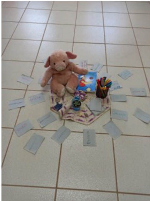
Foto 4: Círculo de Fortalecimento de Vínculos realizado na Instituição LBV