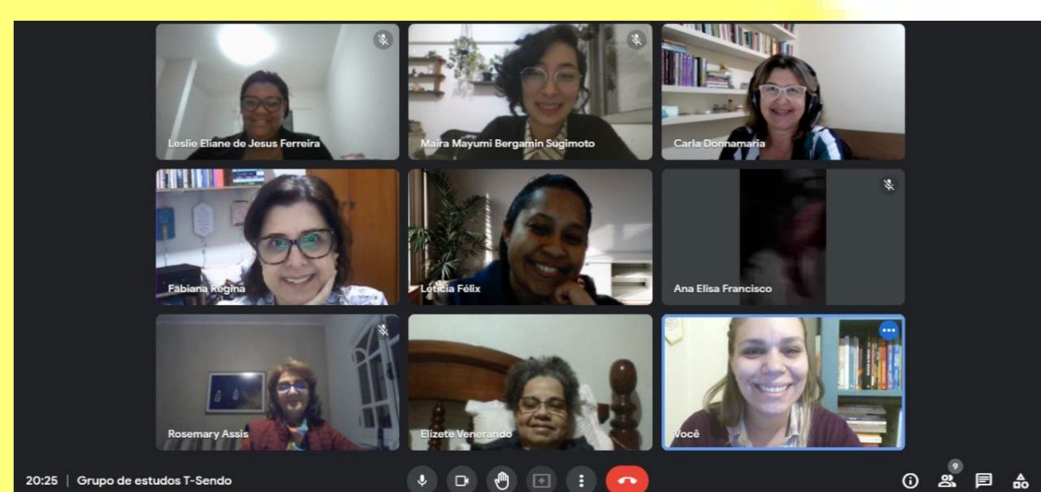
Encontros online do Grupo de Estudos do Projeto T-Sendo Redes