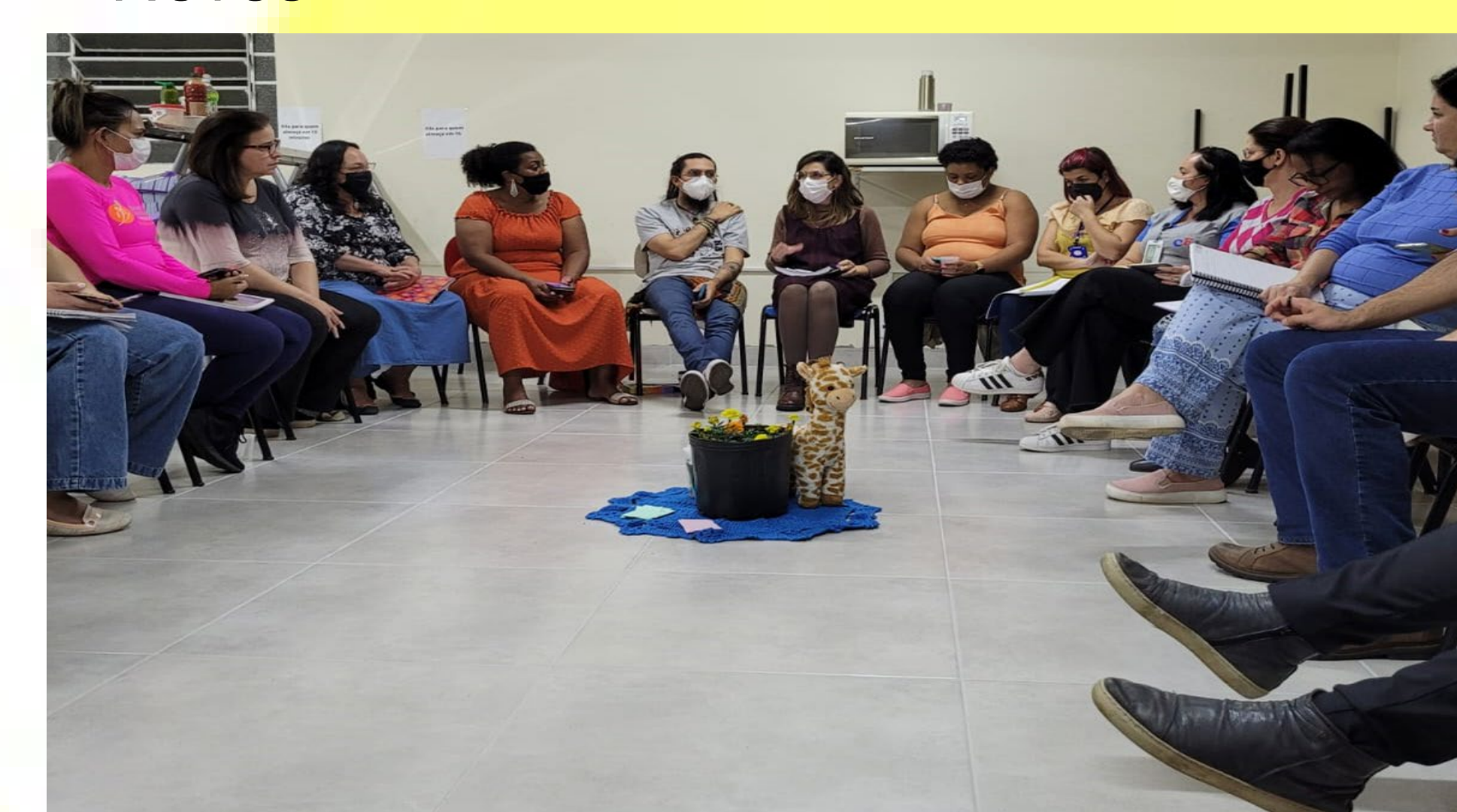
Oficina de Círculo de Tratamento de Conflito