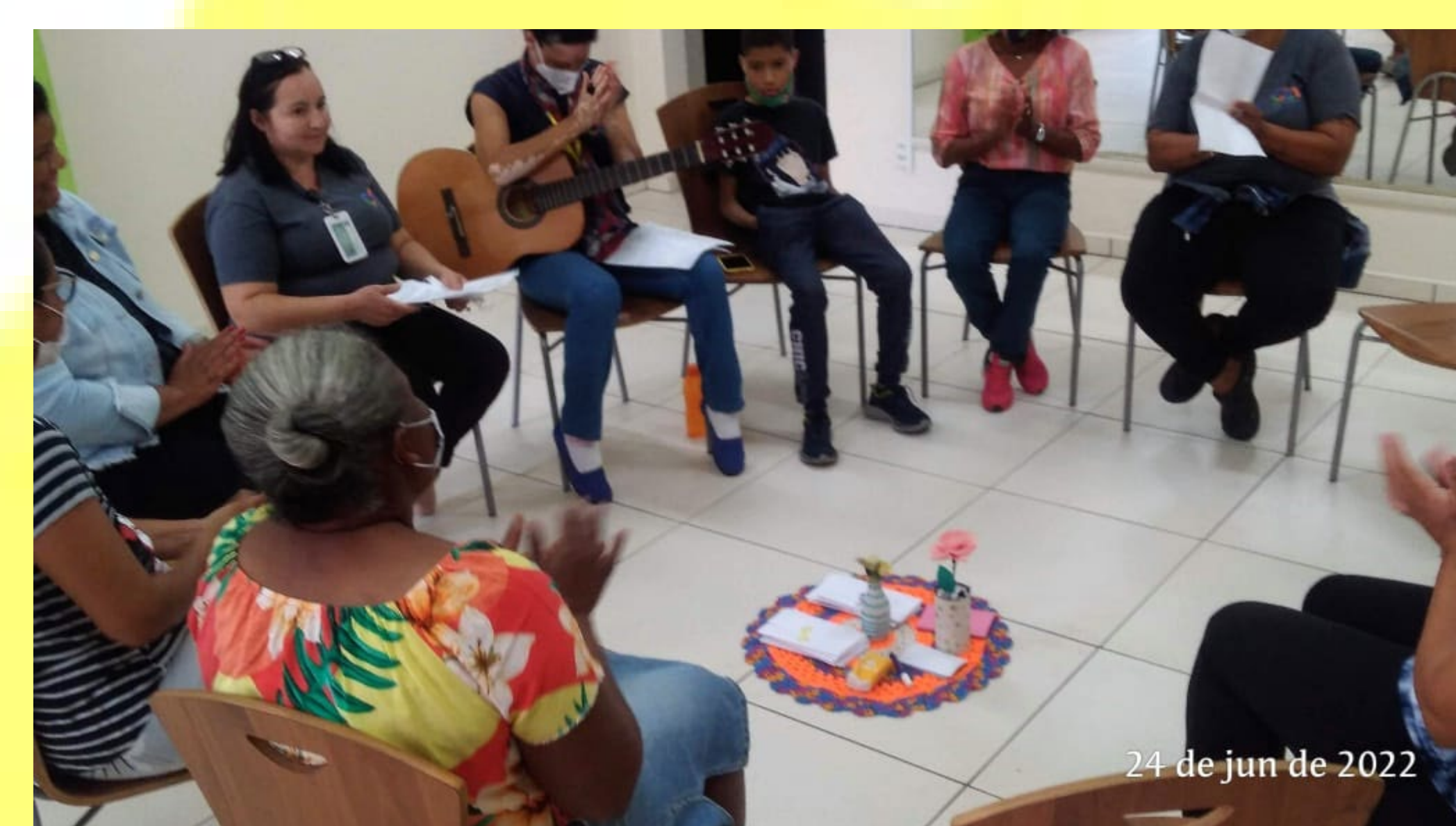
Círculo realizado no Serviço Complementar PCD