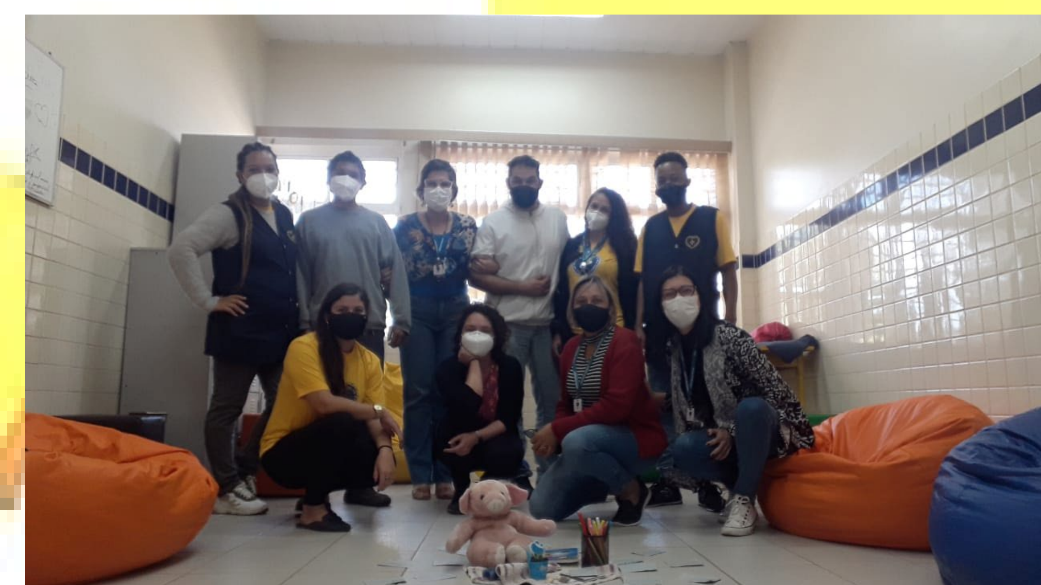
Círculo realizado na instituição LBV