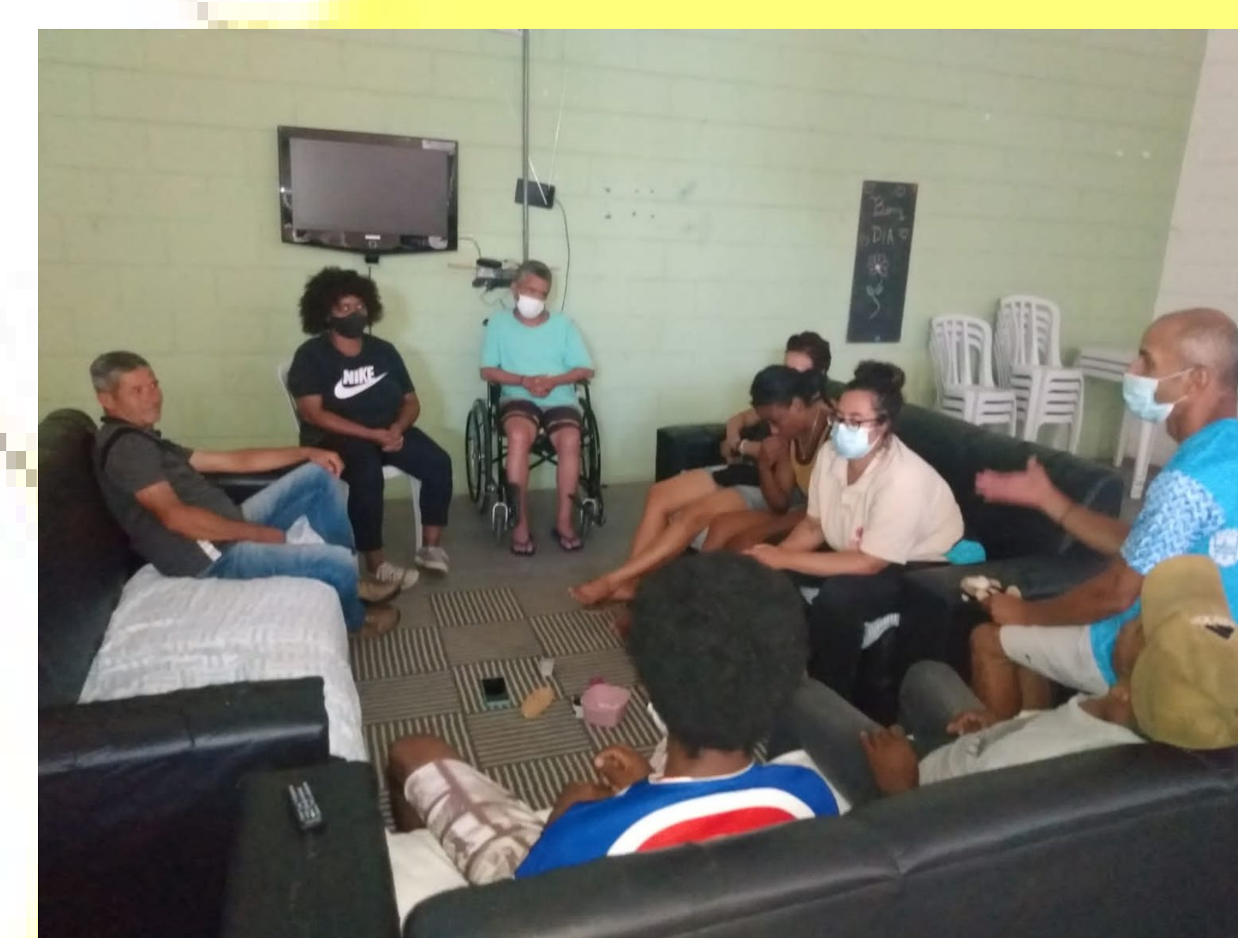
Círculo realizado na instituição Santa Dulce